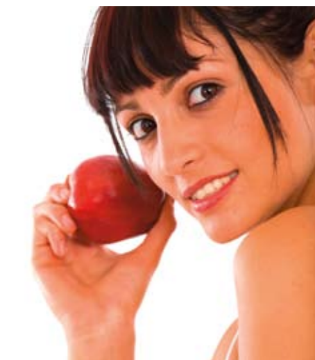
34 Abnehmen mit dem Mond

Impressum „Mondkalender 2008“: Verlag & Herausgeber: Equis GmbH, Eichmattstrasse 97, CH-6331 Hünenburg/Schweiz E-mail: office@mondkraft.com, Internet: http://www.mondkraft.com Vertrieb: ASV GmbH/D-13129 Berlin (D), Morawa&Co/A-1010 Wien (D)