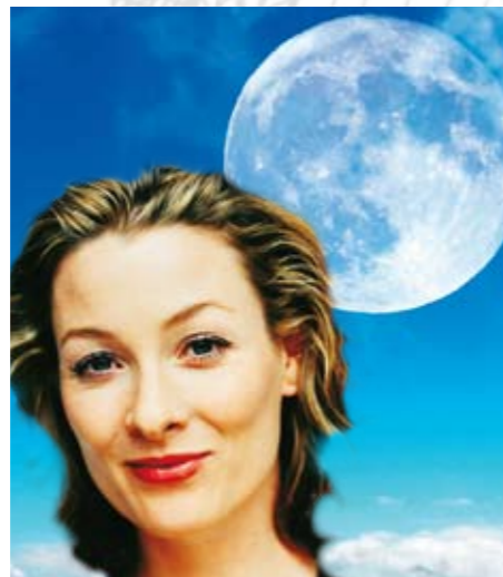
28 Wenn der Mond für die Schönheit scheint