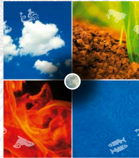
18 Die Mondstände