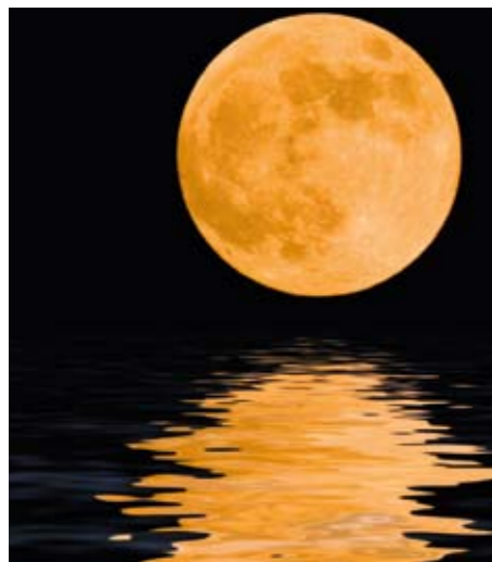
6 Zu Gast auf dem Mond