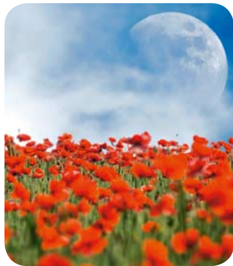
20 Die Wirkung des Mondes auf Natur & Garten