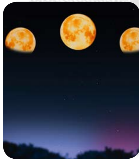
12 Der Mond, der Wandelbare