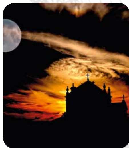
38 Eine Mythologische Mondreise